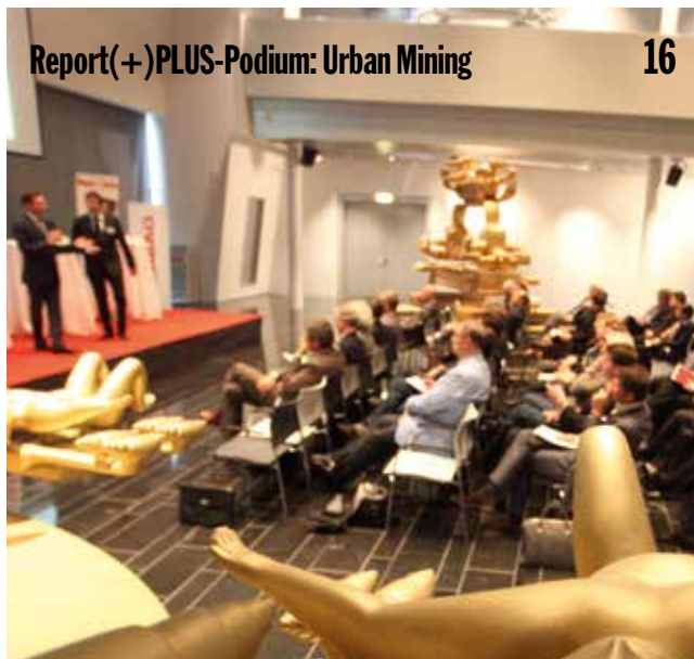
Report(+)PLUS-Podium: Urban Mining