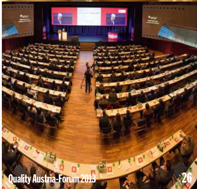
Quality Austria-Forum 2013